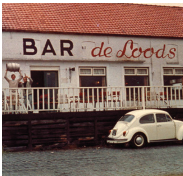
Kortgene, Bar de Loods, jaren '60